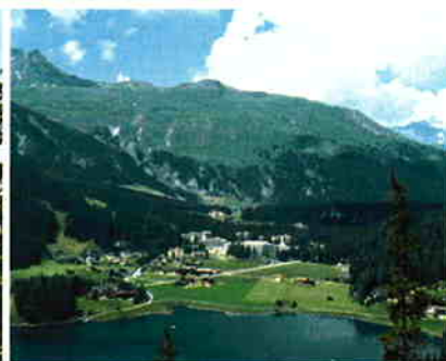
Direkt am See gelegen: die Deutsche Hochgebirgsklinik in Davos.